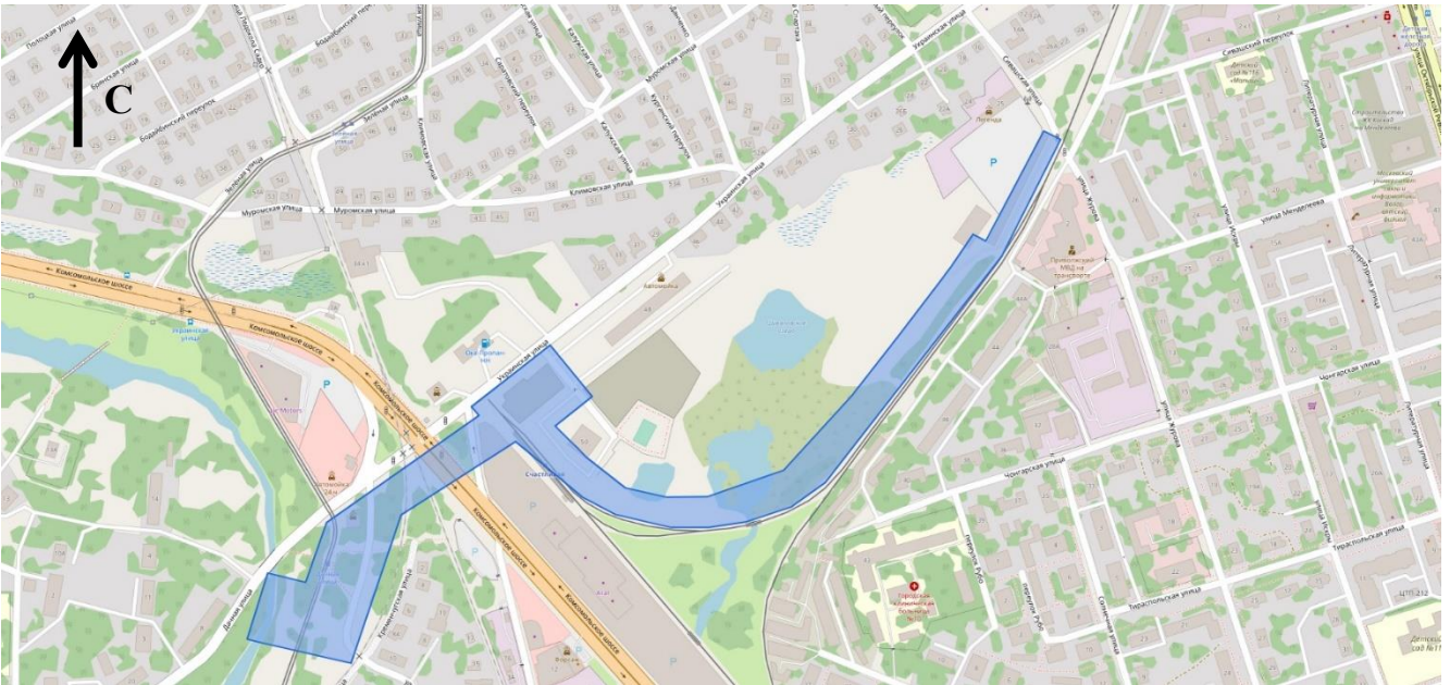
Схема границ подготовки документации по планировке территории (арх. № 85/22)